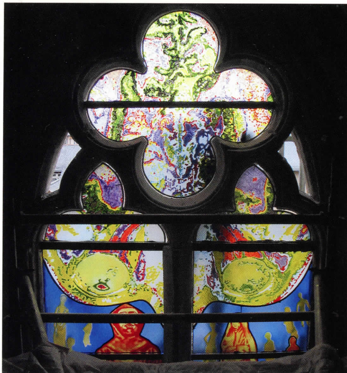
Vitraill de Stéphane Belzère à la cathédrale Notre-Dame de Rodez.