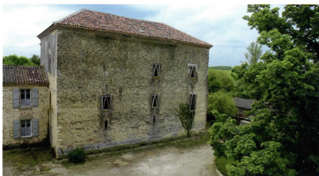
Le château d'Aon.

Il subit donc de nombreuses transformations, jusqu'à l'inscription de ses façades et toitures à l'inventaire supplémentaire des Monuments historiques en 1988, avec le sol et le sous-sol de la motte castrale, la chapelle et ses vestiges de décors peints. Propriété de la petite commune de Hontanx, qui compte aujourd'hui moins de cinq cent cinquante