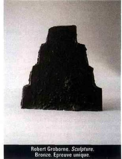
Robert Groborne. Sculpture. Bronze. Epreuve unique.

Une vingtaine de sculptures bifaces en bronze et en plomb – de forme arrondie ou proche du trapèze – sont exposées à la galerie Alain Margaron qui représente l'artiste depuis 2005. Comme pour se jouer des rigueurs de la géométrie, les contours de ces œuvres en trois dimensions, proposées en tirage unique, sont ponctuées d'accidents d'irrégularité, d'éclatements qui arrêtent le regard et nous questionnent. Une patine très travaillée leur