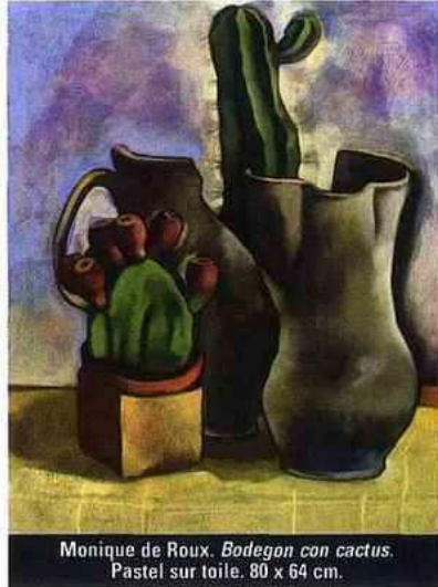
Monique de Roux. Bodegon con cactus. Pastel sur toile. 80 x 64 cm.

Voilà une exposition de souvenirs, d'impressions de voyages signés par une artiste qui vécut de nombreuses années au Panama et qui en garde des images très personnelles. Comme dans un état de semi-conscience, elle nous livre des scènes très colorées, où les personnages mais aussi les objets semblent saisis par le poids du temps tout en gardant intacte leur apparence extérieure. On pense à Gauguin, à Piero Della